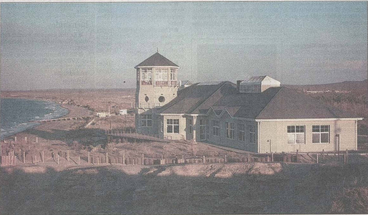
La ubicación de Ecocentro es inmejorable: está al lado del mar, en la ciudad de Puerto Madryn